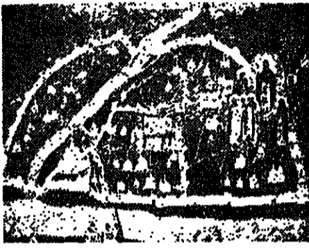
اقولقة تصوره مصنع المدينة القديم